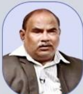
E. SEENIAH SIR World History