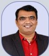
C. Hari Krishna Sir Science & Technology, Environment