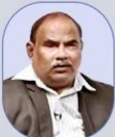
E. SEENAIH SIR World History