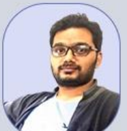
Fazal Sir Economy