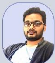
Fazal Sir Economy